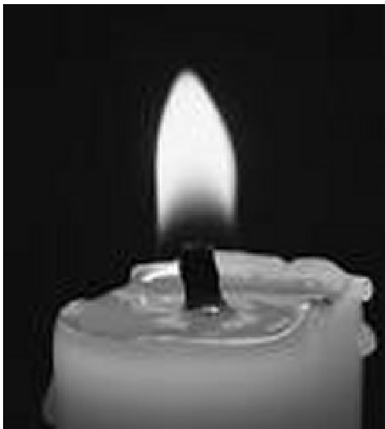
'Wij herinneren ons de namen', 22 november '09